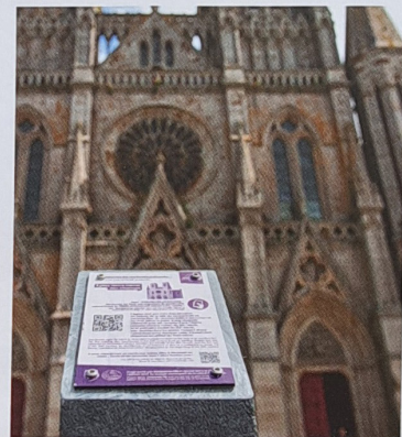
Porteur du projet Avranches en histoire, Radio Sud Manche a réalisé des contenus multimédias à télécharger via un QR code pour valoriser les richesses patrimoniales de la commune.