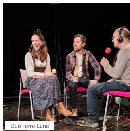
Duo Terre Lune